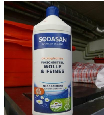
lessive pour le système aqua clean