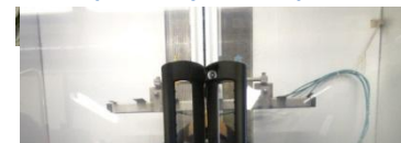
système de séchage pour vêtement délicat