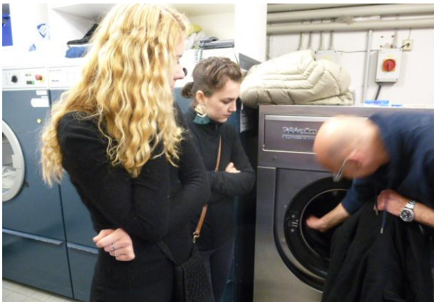
machine aqua clean

Nous avons été reçues à l'Opéra de Stuttgart le jeudi. La classe scindée en deux groupes de visite a pu visiter tous les services concernant les costumes : le tailleur homme, la couture, les accessoires et les armuriers, la broderie et la plumasserie, le pressing. En ce qui concerne l'entretien des costumes nous avons pu découvrir le système « aqua clean », en plus du lavage traditionnel et du nettoyage à sec. Il permet un compromis entre les deux systèmes de nettoyage courant en utilisant moins d'eau et permettant de laver des tissus comme la laine ou des textiles délicats. La ville de Stuttgart est très engagée au point de vue écologique et leur pressing va dans ce sens : circuit fermé des produits chimiques, lessive moins polluante, système aqua clean.