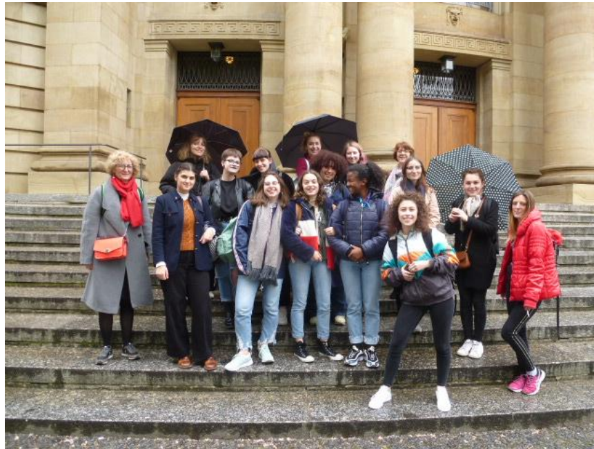
les élèves de 1 DTMS devant l'opéra de Stuttgart

La visite des différents services de fabrication des costumes a été menée par le chef habilleur de l'opéra et les élèves ont pu comparer les différentes méthodes de travail .