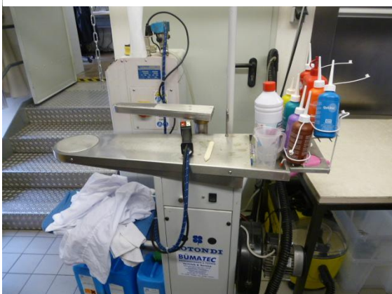
table de détachage